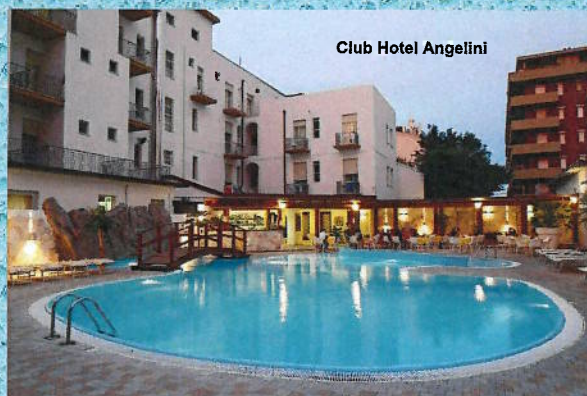
Club Hotel Angelini

IL GRUPPO PESCA G.P.S. FIDAS/AMSA NON SI ASSUME NESSUNA RESPONSABILITA' PRIMA, DURANTE E DOPO LO SVOLGIMENTO DELLA MANIFESTAZIONE.